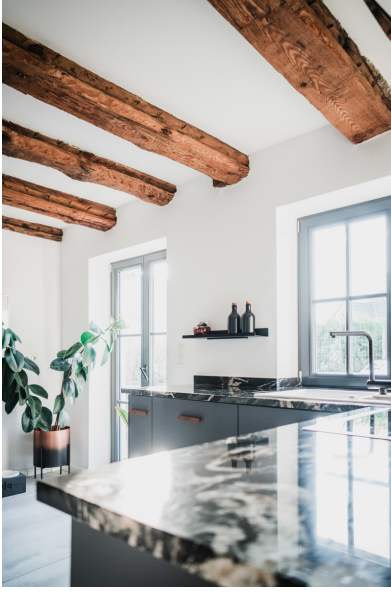
Luxuriöses Ambiente auch in der Küche