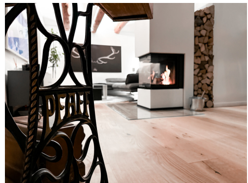
Liebvolle Details sind im gesamten Haus