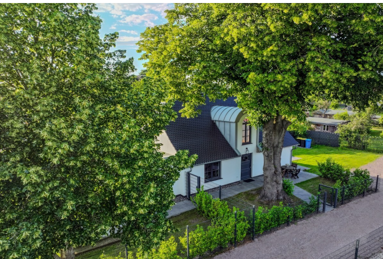
Die jahrhundertealte Linde heißt Sie willkommen.