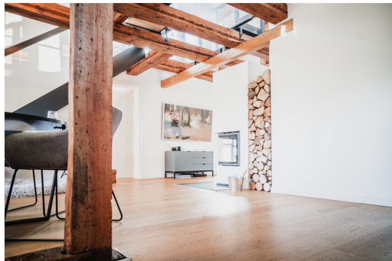
Tradition trifft Eleganz