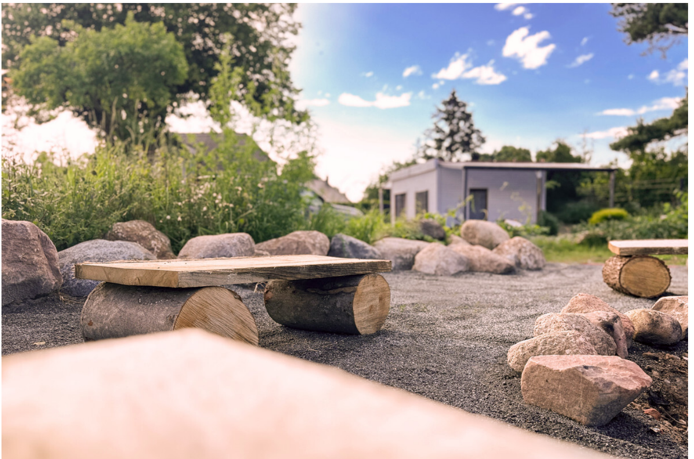
Der große Feuerplatz mit Sitzgelegenheiten