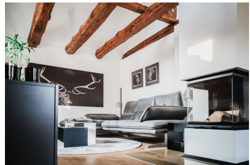
Der Panorama-Kamin sorgt insbesondere im Winter für eine stimmungsvolle Atmosphäre.