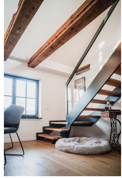
Auch die Treppe wurde maßangefertigt.