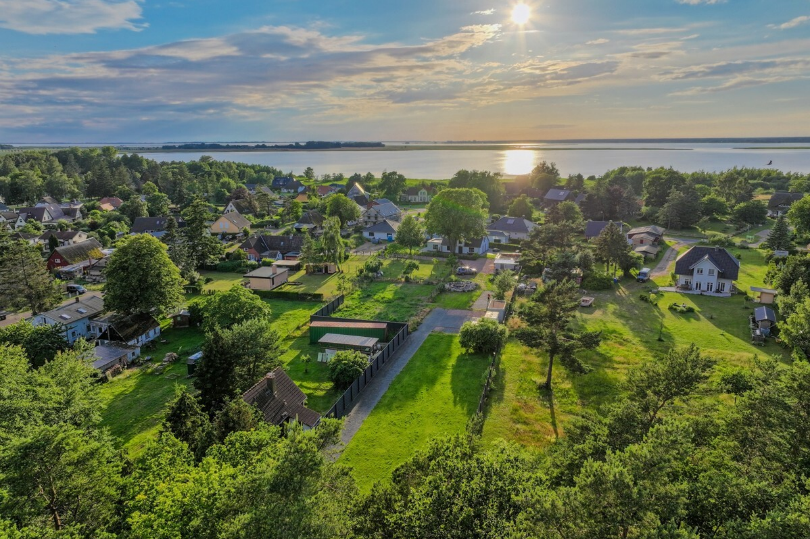
Gelegen zwischen Wald und Bodden