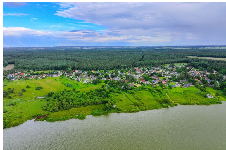
Ein Leben am Wasser