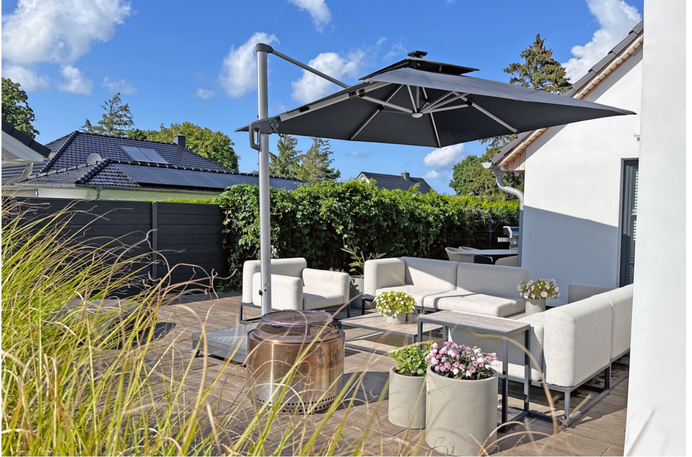
Ungestört entspannen auf einer der Terrassen