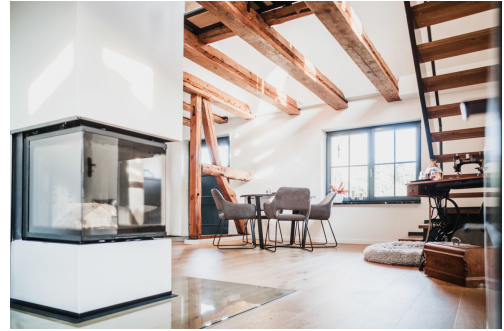
Das über 100 Jahre alte Balkenwerk