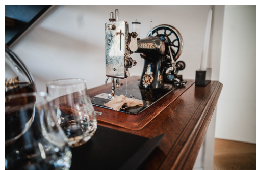
Traditioneller Charme und modernes Design