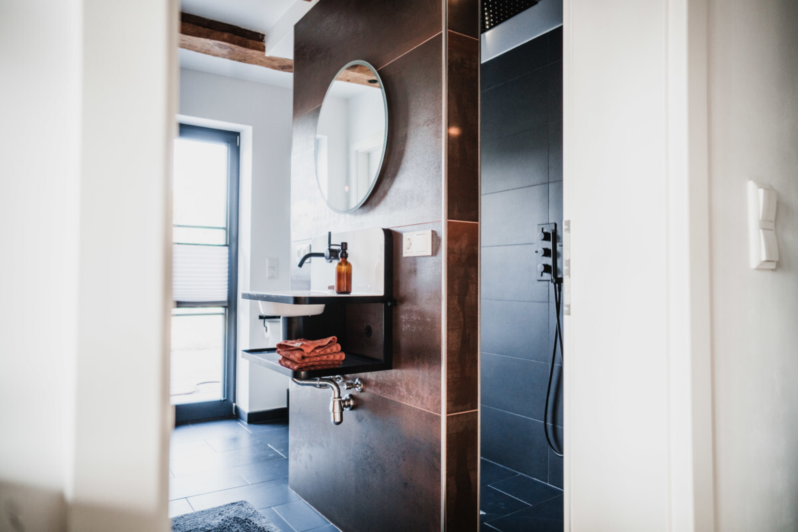
Das untere Badezimmer mit Regendusche