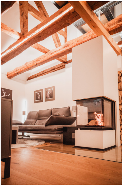
Das Lichtkonzept am Abend