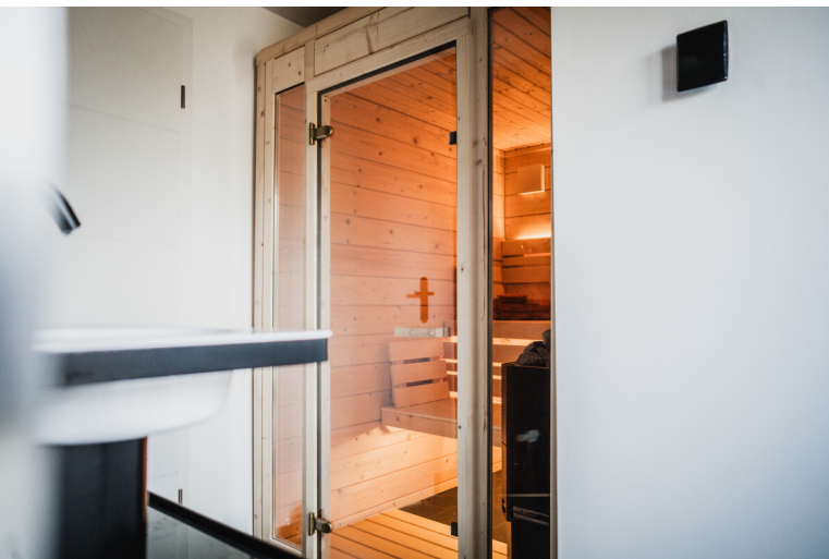
Die Sauna ist eines der vielen Highlights der Immobilie.